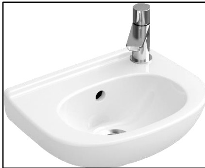
Figuur 3. Fontein

In de toiletruimte wordt een fontein van het merk Villeroy & Boch toegepast, serie O.novo. Deze komt in combinatie met een toiletkraan van Grohe type Eurostyle Cosmopolitan (figuur 3).