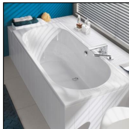
Figuur 7. Badcombinatie (excl. Kraan)