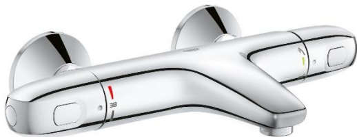
Figuur 6. Badmengkraan

In de badkamer van de woning wordt een badcombinatie toegepast van Villeroy & Boch serie O.novo (figuur 7). Deze wordt uitgevoerd met een badmengkraan en een handdouche van Grohe (figuur 6).