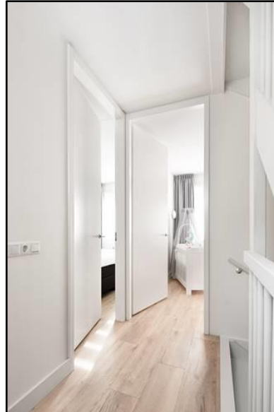
Figuur 1. Verdi binnendeur met stalen Verdi binnenkozijnen.