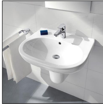
Figuur 5. Wastafel

In de badkamer worden wastafels toegepast van het merk Villeroy & Boch, serie O.novo (figuur 5). Deze wordt uitgevoerd in combinatie met een wastafelmengkraan van het merk Grohe, type Eurostyle Cosmopolitan.