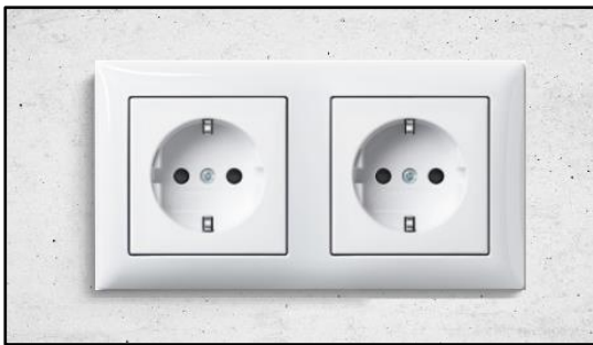
Figuur 2. Dubbele wandcontactdoos van Busch Jaeger

De elektraleidingen worden in de steenachtige wanden en/of vloeren weggewerkt met uitzondering van de leidingen in de CV / technische ruimten, berging en vliering, zolder en berging. De lichtpunten, schakelaars en wandcontactdozen zijn per ruimte op tekening aangegeven; de plaats is bij benadering aangegeven op de tekening, de exacte plaats wordt in het werk bepaald. De schakelaars die toegepast worden zijn afkomstig van het merk Busch Jaeger, type SI Balance en zal worden uitgevoerd in kleur ral 9010. In de onderstaande figuren wordt een impressie gegeven van de schakelaars en wandcontactdozen.