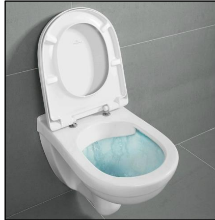
Figuur 2. Wandcloset

In zowel de toiletruimte als de badkamer wordt een wandcloset en een closetzitting met deksel toegepast van Villeroy & Boch serie O.novo, kleur wit (figuur 2).