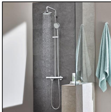
Figuur 4. Douchecombinatie

De badkamer wordt ingericht met een douchecombinatie van Grohe New Tempesta Cosmopolitan, bestaande uit: Thermostatische douche mengkraan, glijstang met een vaste hoofddouche en handdouche (figuur 4). Daarnaast wordt de douchecombinatie gecombineerd met een glazen douchescherm en een draingootsysteem.