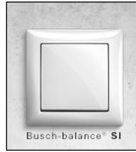
Figuur 3. Schakelaar van Busch