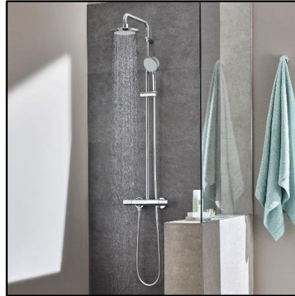
Figuur 4. Douchecombinatie

De badkamer wordt ingericht met een douchecombinatie van Grohe New Tempesta Cosmopolitan, bestaande uit: Thermostatische douche mengkraan, glijstang met een vaste hoofdouche en handdouche (figuur 4). Daarnaast wordt de douchecombinatie gecombineerd met een glazen douchescherm en een draingootsysteem.