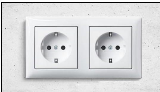
Figuur 2. Dubbele wandcontactdoos van Busch Jaeger

De elektraleidingen worden in de steenachtige wanden en/of vloeren weggewerkt met uitzondering van de leidingen in de CV / technische ruimten, berging en vliering, zolder en berging. De lichtpunten, schakelaars en wandcontactdozen zijn per ruimte op tekening aangegeven; de plaats is bij benadering aangegeven op de tekening, de exacte plaats wordt in het werk bepaald. De schakelaars die toegepast worden zijn afkomstig van het merk Busch Jaeger, type SI Balance en zal worden uitgevoerd in kleur ral 9010. In de onderstaande figuren wordt een impressie gegeven van de schakelaars en wandcontactdozen.